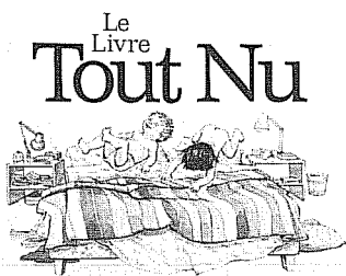
Une histoire écrite par Kathy Stinson et illustrée par Heather Collins

Le livre tout nu. Kathy Stinson. Illus. Heather Collins. Toronto, Annick Press, 1987. Non-paginé 4.95$. ISBN 0-920303-96-X.